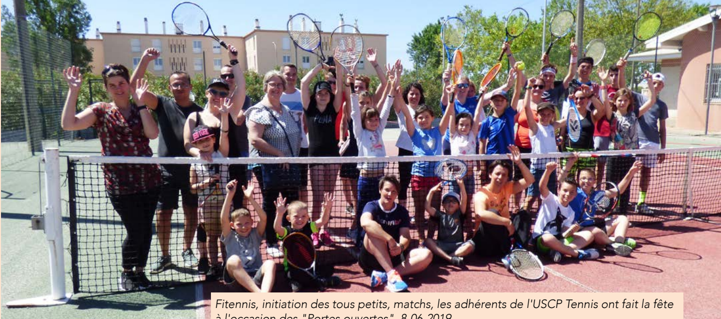
Fitennis, initiation des tous petits, matchs, les adhérents de l'USCP Tennis ont fait la fête à l'occasion des "Portes ouvertes". 8-06-2019