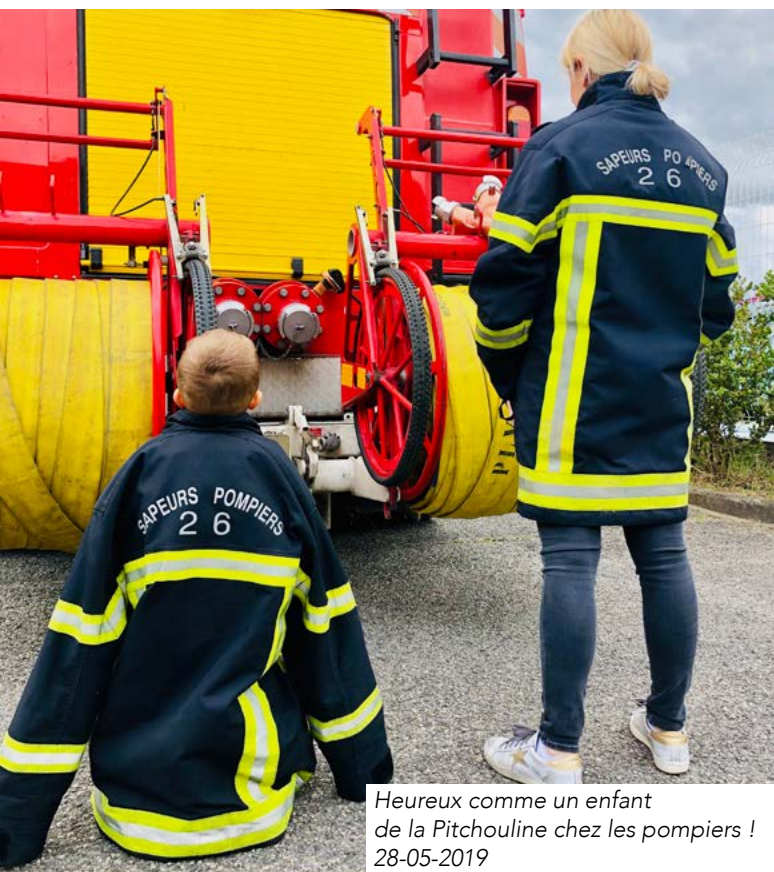
Heureux comme un enfant de la Pitchouline chez les pompiers ! 28-05-2019