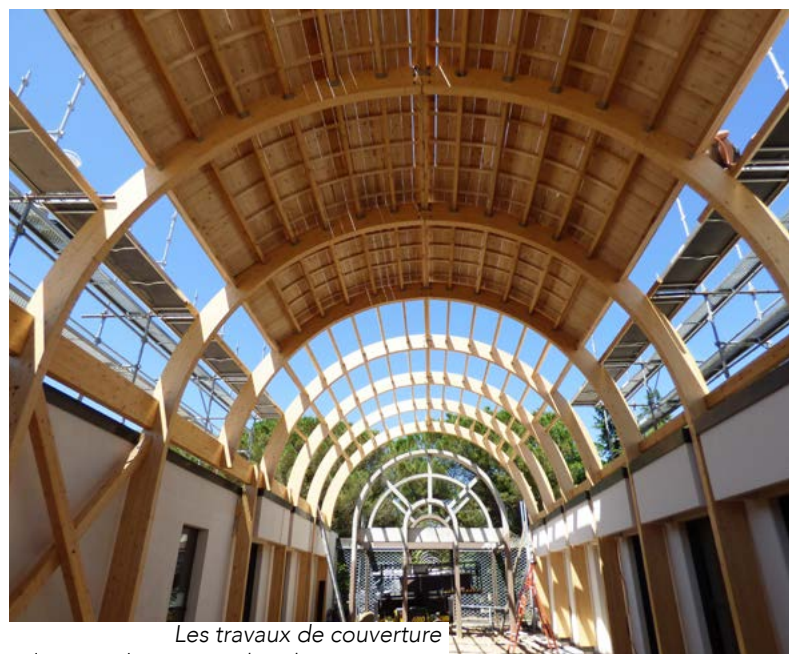
Les travaux de couverture du Patio du centre culturel Louis Aragon avancent. Livraison prévue début juillet.