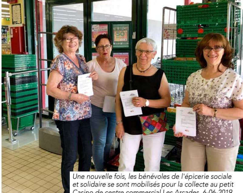
Une nouvelle fois, les bénévoles de l'épicerie sociale et solidaire se sont mobilisés pour la collecte au petit Casino de centre commercial Les Arcades. 6-06-2019