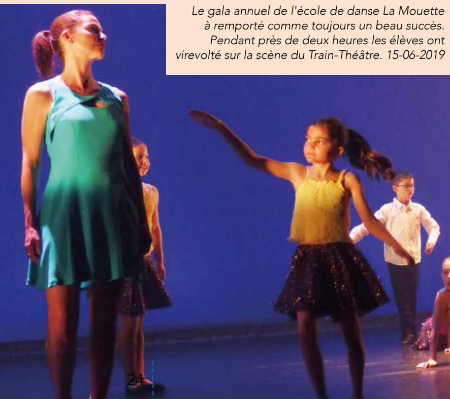
Le gala annuel de l'école de danse La Mouette à remporté comme toujours un beau succès. Pendant près de deux heures les élèves ont virevolté sur la scène du Train-Théâtre. 15-06-2019