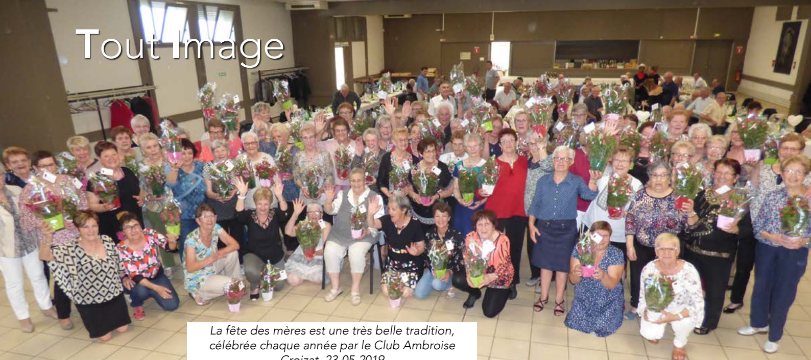
La fête des mères est une très belle tradition, célébrée chaque année par le Club Ambroise Croizat. 23-05-2019