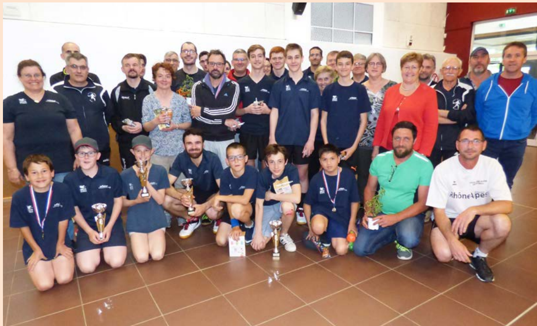
Certes, il s'agissait bien d'un tournoi, mais la compétition organisée par le Tennis de table portois était surtout l'occasion de se retrouver entre amis. 19-05-2019