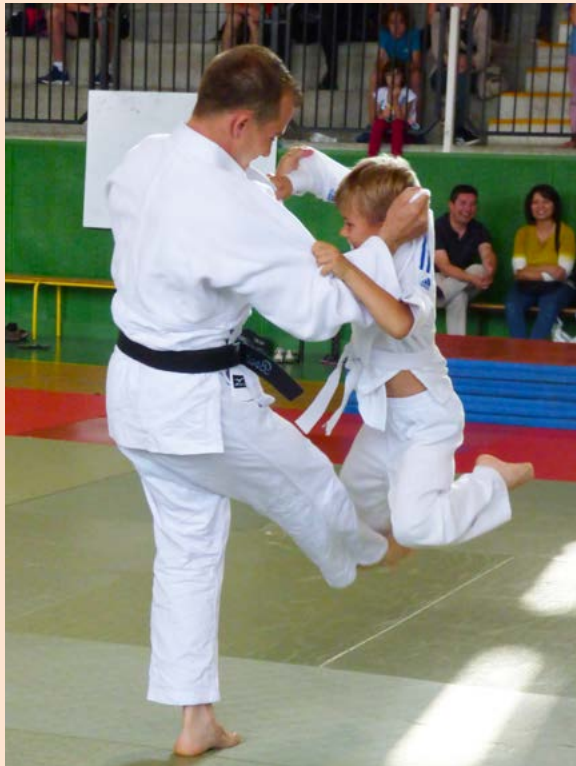
Le Judo jujitsu taïso nous ont gratifiés de très belles démonstrations comme ici avec les tout petits lors de la fête annuelle du judo. 14-06-2019