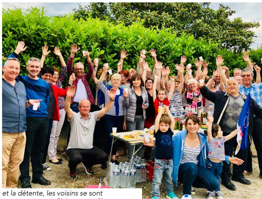
Dans la convivialité, la joie et la détente, les voisins se sont retrouvés dans les quartiers, comme ici aux Chênes, aux Champs Fleuris, aux Amandines et à la Résidence du Centre rue Léo Lagrange.