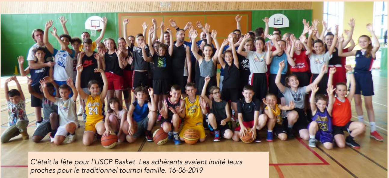
C'était la fête pour l'USCP Basket. Les adhérents avaient invité leurs proches pour le traditionnel tournoi famille. 16-06-2019