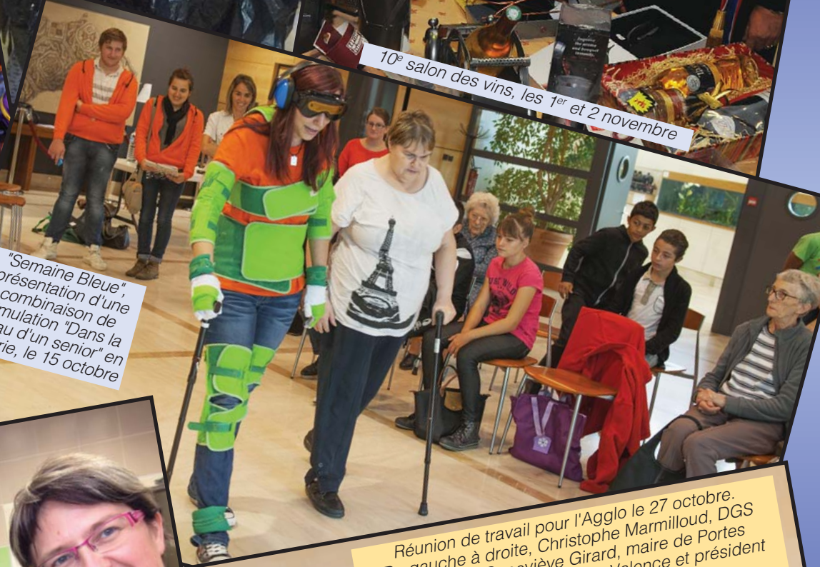
"Semaine Bleue", présentation d'une simulation "Dans la peau d'un senior" en mairie, le 15 octobre