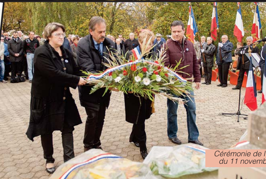
Cérémonie de l'... du 11 novembre