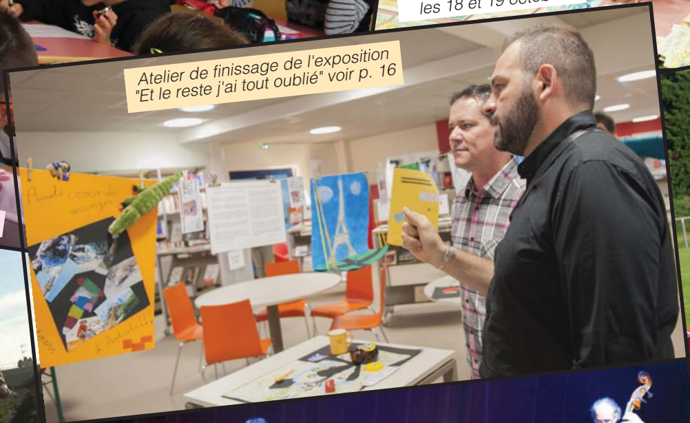
Atelier de finissage de l'exposition "Et le reste j'ai tout oublié" voir p. 16