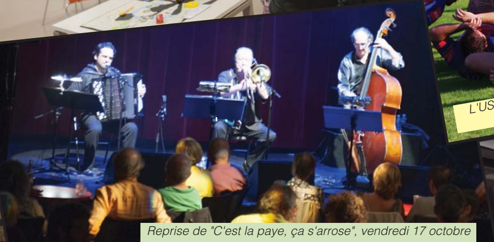
Reprise de "C'est la paye, ça s'arrose", vendredi 17 octobre