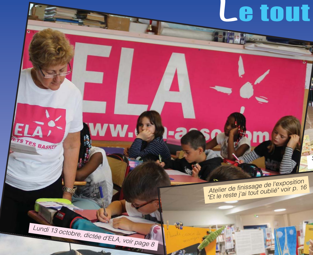
Lundi 13 octobre, dictée d'ELA, voir page 8