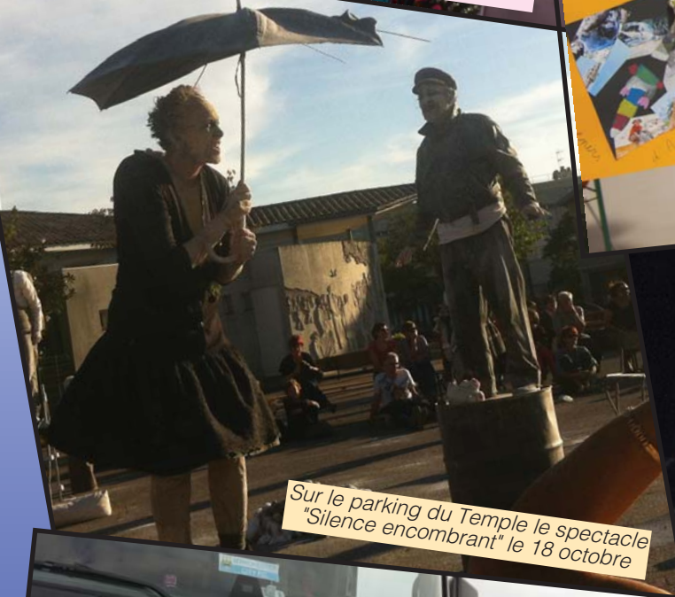
Sur le parking du Temple le spectacle "Silence encombrant" le 18 octobre