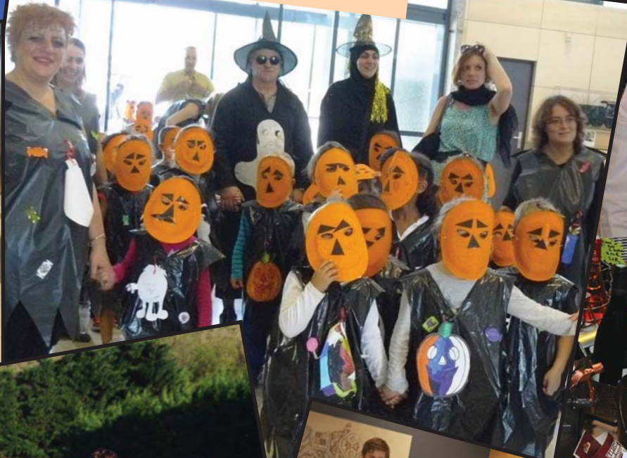
La maternelle Pasteur fête Halloween en mairie, le 17 octobre