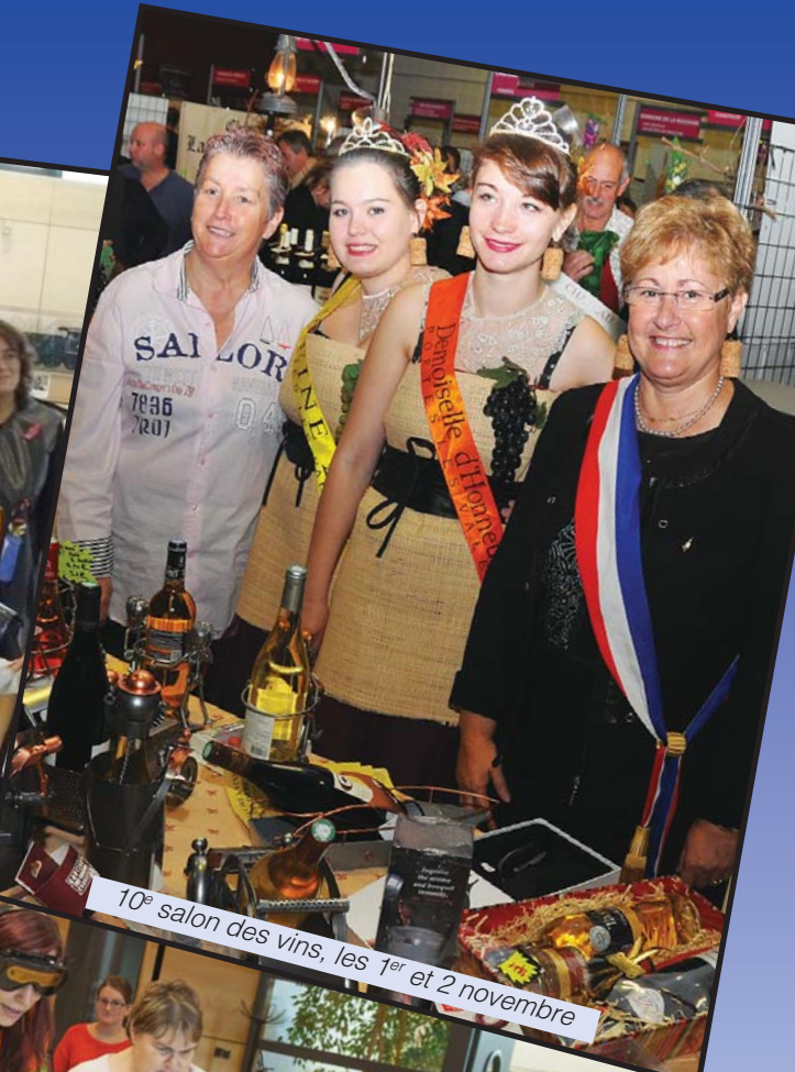
10 e salon des vins, les 1 er et 2 novembre