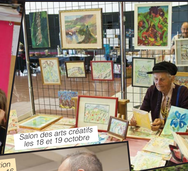
Salon des arts créatifs les 18 et 19 octobre