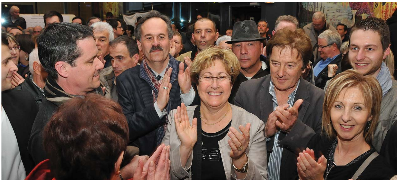
20 h 30, la victoire ! Explosion de joie chez les membres de la liste « Agir et mieux vivre » et leurs sympathisants