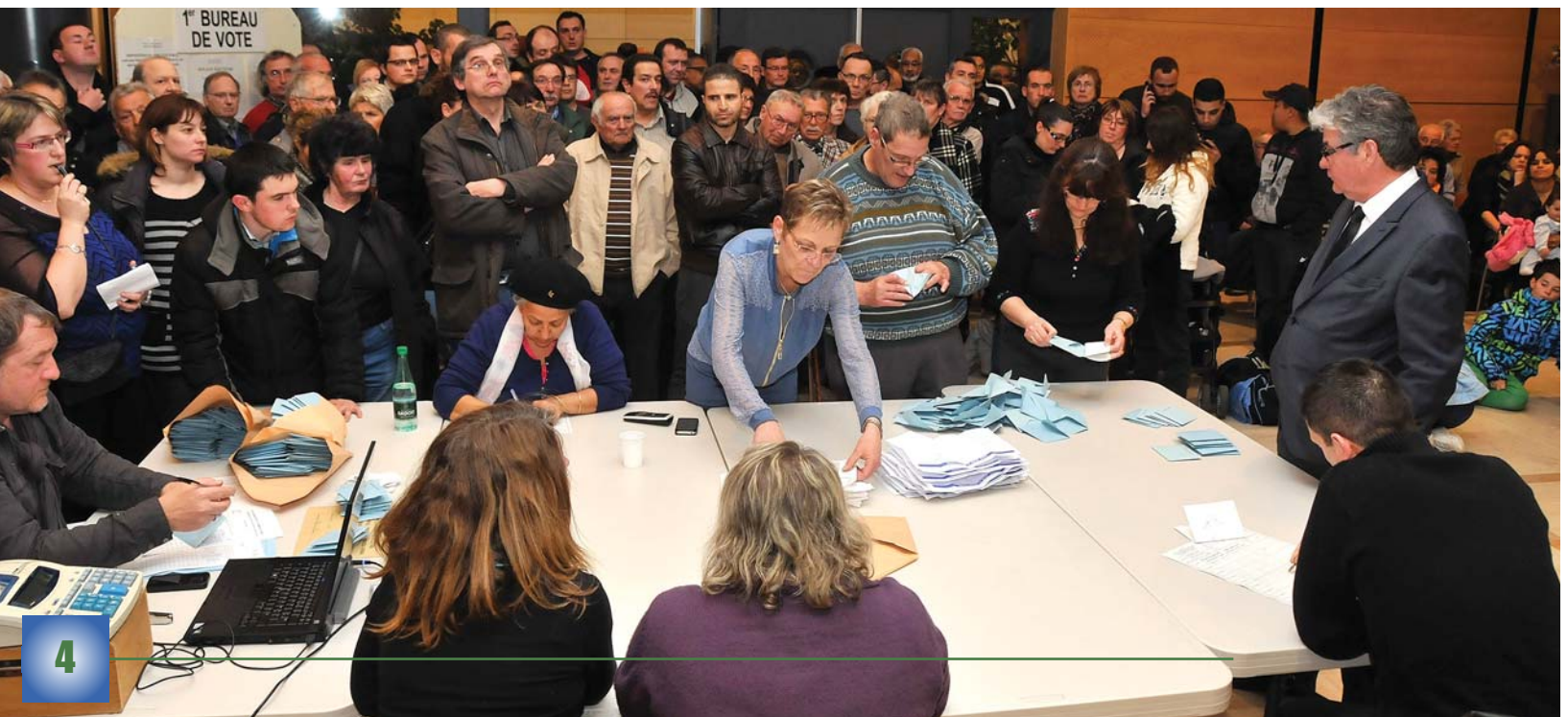
Une foule attentive en attente des résultats